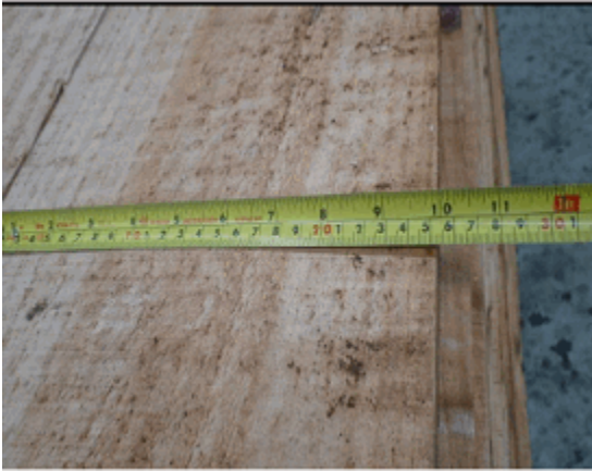
FIGURA 5: Rango del ancho, 195mm - 250mm