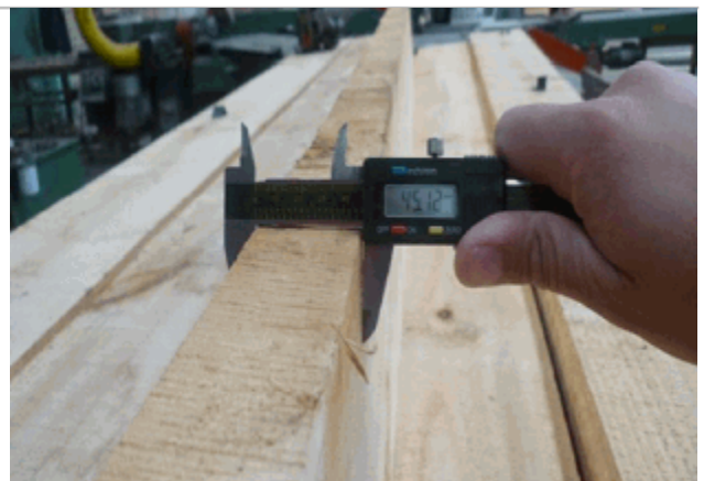
FIGURA 4: Rango del espesor, 45,12 mm - 46,8 mm