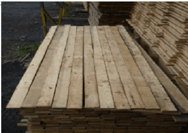
VISTA GENERAL DEL PRODUCTO